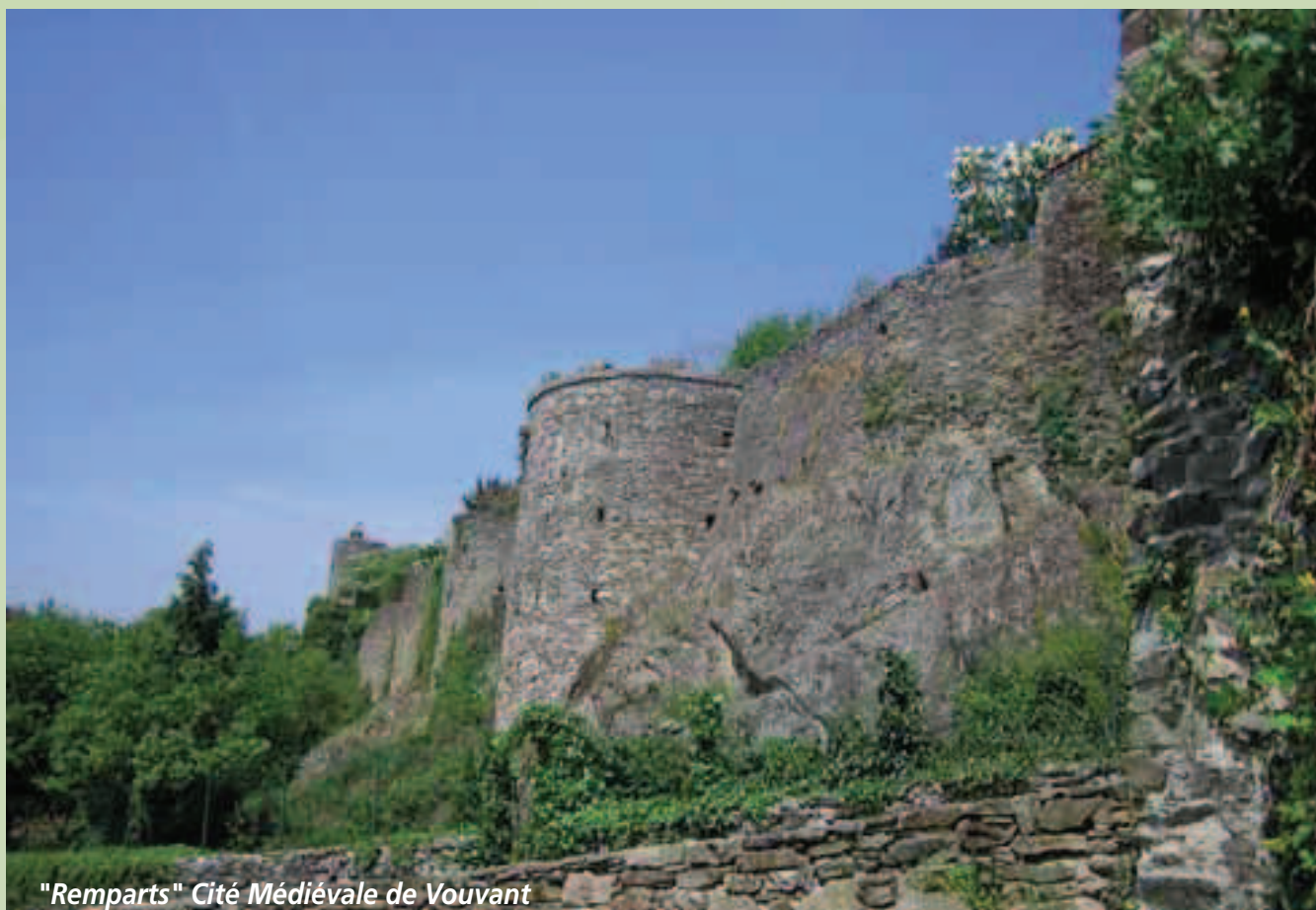
"Remparts" Cité Médiévale de Vouvant

E-mail : camping.la.jolietiere@wanadoo.fr www.campinglajolietiere.fr.st