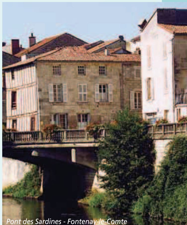
Pont des Sardines - Fontenay-le-Comte