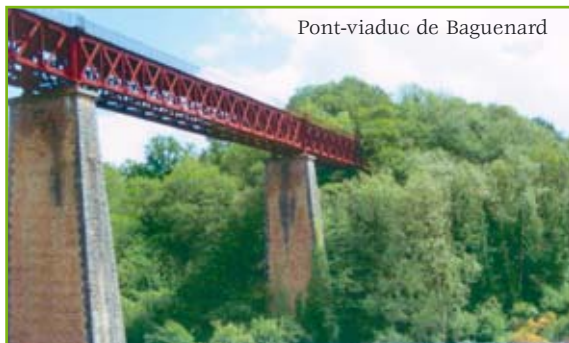
Pont-viaduc de Bagnenard