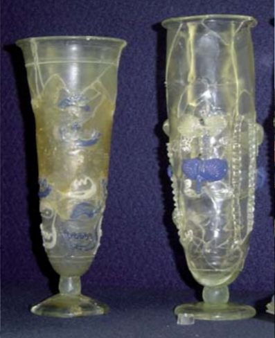
Verrerie gallo-romaine. II e siècle de notre ère.