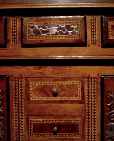
Détail de marquetterie d'un vaisselier du XIX e siècle.