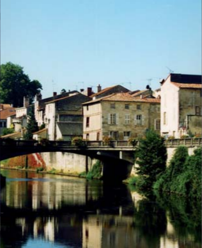
Pont des sardines, passage entre la ville fortifiée et le faubourg des Loges.