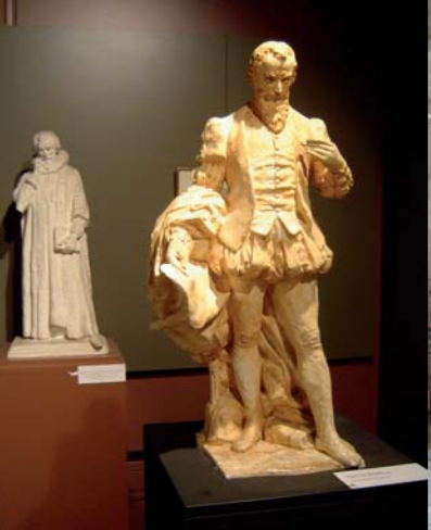
François Viète (1540 - 1603). Inventeur de l'algèbre moderne.