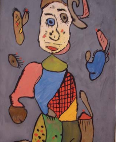
Yvon le Baugeur de Gaston Chaissac (1910 - 1964)