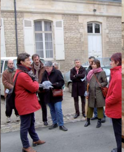
Visite de la caserne Belliard, édifice du XVIII e siècle.