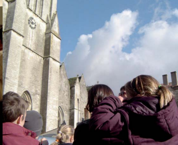
Visite sur les pas de Rabelais