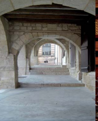
Arcade de la place Belliard.