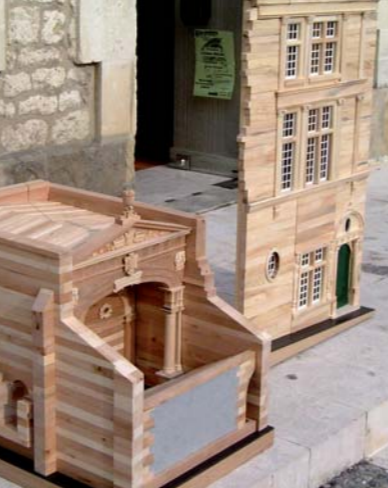
Maquettes de la fontaine et de l'hôtel de la Pérate.