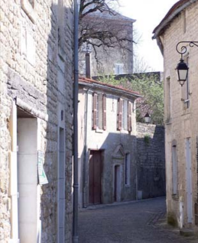
Rue Goupilleau, ruelle descendant vers la fontaine du XVI e siècle.