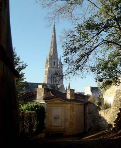
Parc Baron, parc romantique du XIX e siècle sur les ruines du château féodal.