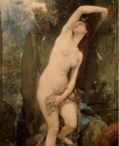
Diane chassant l'amour. Paul Baudry (1828 - 1886)