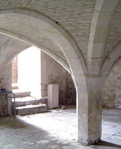
Cave voûtée de l'hôtel Gobin-Fourestier.