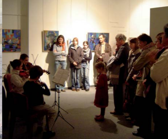
Musique au musée : découverte des collections en partenariat avec l'école de musique.