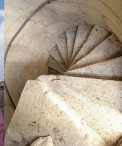
Escalier XV e siècle, église Notre-Dame.